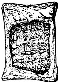
Письмо в клинописи, глиняная оболочка которого устроена с передней части. Оно происходит со времен Ноя, найдено в Уре Халдейском.

мена Ноя. Слова Асхурбани-пала (в Библии он назван Оснаппаром) указывают на допотопные записи. Он сказал: «Я был рад читать записи на камне с допотопных времен.» И если мы еще дальше идем назад до начала человечества и к указаниям, что Адам писал или имел записанные сведения, то у нас есть подтверждение в книге Бытие 5:1: «Это книга поколения Адама.» (По англ. Библии.)