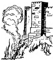
ДОЛИНА ХИННОМ ГЕЕННА

призваны братья Христа, Он объявляет относительно «козлов»: «Сии пойдут на вечное отсечение, где останутся навсегда отсеченными от жизни (по-гречески: коласис), а праведные—в жизнь вечную.» (Матфей 25:46, ИМ; ЭД ) Следовательно козлы будут навсегда отсечены от жизни и это будет их вечным наказанием.